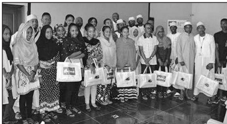
Les bacheliers primés par Telma reçus au siège de l'opérateur

vendredi en présence des familles, de la presse et des cadres de la société.